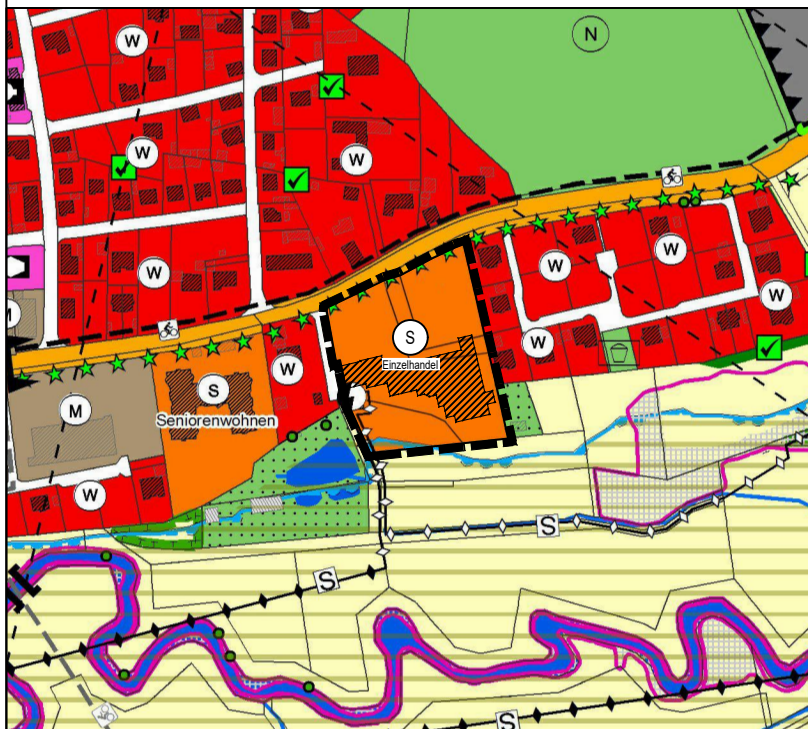
3. Änderung des Flächennutzungs- und Landschaftsplans